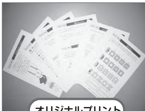
オリジナルプリント